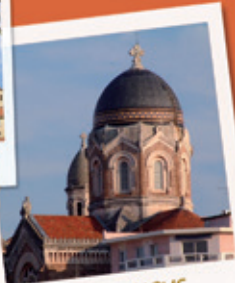
LA BASILIQUE, ST-RAPHAEL 20 KM