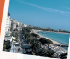
CANNES 20 KM