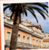
GRASSE 30 KM