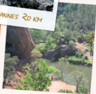
LAC DE L'ÉCUREUIL, MASSIF DE L'ESTEREL