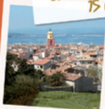
ST-TROPEZ 45 KM