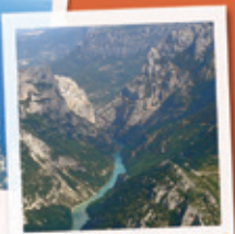
LES GORGES DU VERDON 75 KM