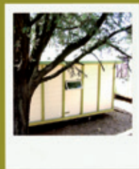
NEMO / TRIANON