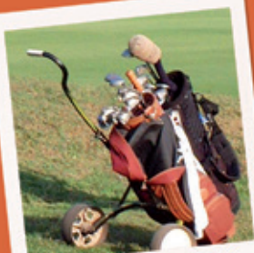
GOLF DE VALESCURE 15 KM