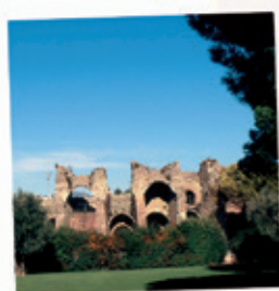
LES ARENES DE FREJUS