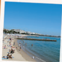
BAIE DE CANNES