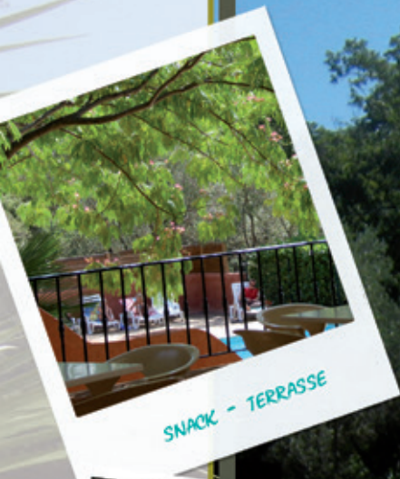
SNACK - TERRASSE