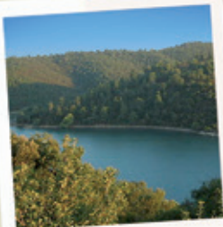
LE LAC DE ST-CASSIEN