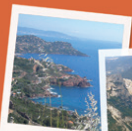
TRAYS 20 KM

Situato al cuore del massiccio dell' Estérel, del paese di Fayence, ed a due passi della regione dell' Alpes maritimes, (Cannes, Nizza) il nostro campeggio è il luogo ideale per il riposo, le passeggiate e le escursioni. A 15 minuti dalle spiagge e delle insenature dell' Estérel, vicino al Lac di St Cassien e al lago di l' Avellan, ed a 1 ora di Vintimille (frontiera italiana).