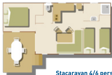
Stacaravan 4/6 pers.

Deze stacaravans hebben een, aan de caravan gebouwd, overdekt terras. Ze beschikken over een ouderslaapkamer met een tweepersoonsbed en een slaapkamer met twee bedden (lits jumeaux). Tevens is er een slaappleaats voor 2 personen mogelijk in de woonkamer. Badkamer met douche. Toilet. Keuken met koelkast en 4 kookplaten. Buiten staan een tuinafmeublement en een parasol tot uw beschikking.