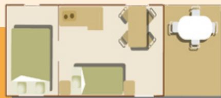
Woonwagen 4 pers.

Onze 4 woonwagens staan in een gezellig "woonwagenkamp" met een gezamenlijke barbecue van het type kampvuur.