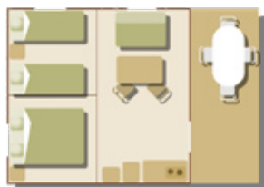
Fun Flower 4/6 pers.

De bungalowtent van stevige stof combineert kampeerplezier met comfort en sluit nadelen uit. De tenten zijn 4,5m bij 4,5m groot, van alle gemakken voorzien, en beschikken over twee slaapkamers, 7 slaappleaatsen, een woonkamer met open keuken (koelkast, gastoestel, serviesgoed) en een tuinafmeublement. Géén badkamer en toilet.