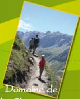
Domaine de la Chartreuse