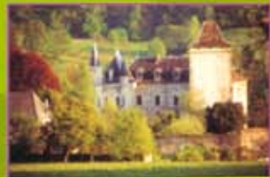
Château de Montfleury