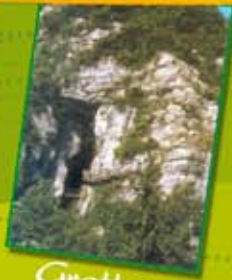
Grottes des Echelles