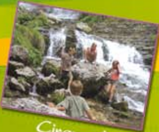
Cirque de Saint Mème