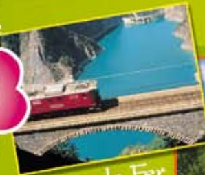
Chemin de Fer de la Mure