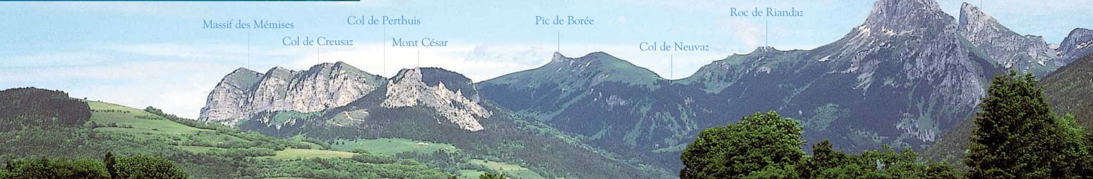
Col de Neuvaz