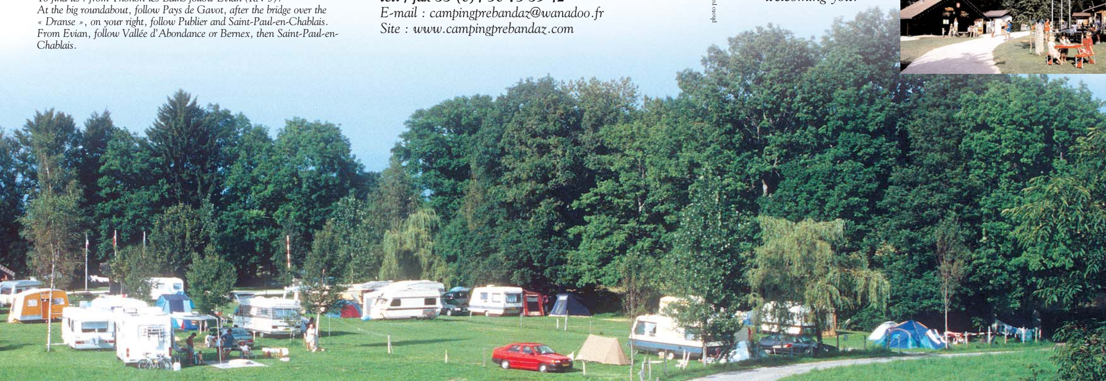
graphisme : Dynamic 19 - impression : Vautoux